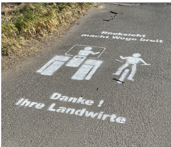
Sinnbild.

Der Rat der Stadt Hemmingen hat 3500 Euro in den laufenden Haushalt eingestellt, um etwas für die Verkehrssicherheit zu tun. Ziel ist es, die Bedeutung der gegenseitigen Rücksichtnahme aller Verkehrsteilnehmer im Straßenverkehr zu erhöhen. Der Rat bittet die Stadt Hemmingen, geeignete Maßnahmen vorzuschlagen und dem Rat zur Entscheidung vorzulegen. Dazu gehört aus Sicht des ADFC auch die Sensibilisierung der Autofahrerinnen und Autofahrer für den Mindestabstand von 1,5 Metern beim Überholen von Fahrrädern.